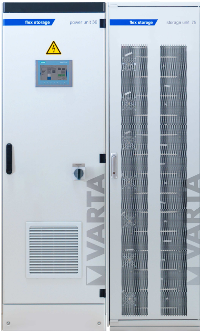
Abbildung 1: E 36/75 – beispielhafte Darstellung (Abbildung ähnlich)