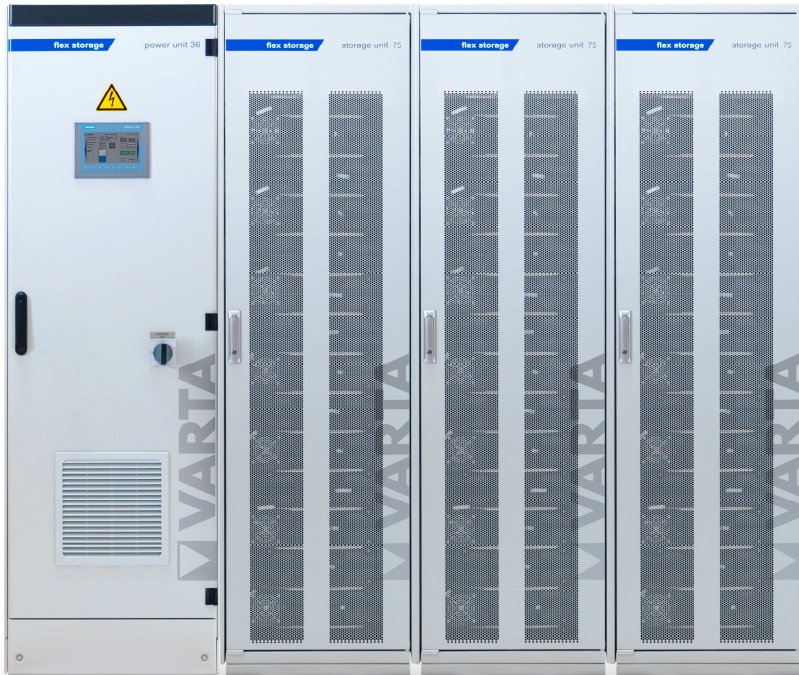
Abbildung 1: E 36/225 (50A ES) –beispielhafte Darstellung (Abbildung ähnlich)