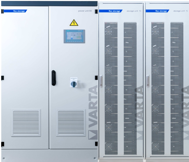
Abbildung 1: E 80/150 (115A ES) –beispielhafte Darstellung (Abbildung ähnlich)