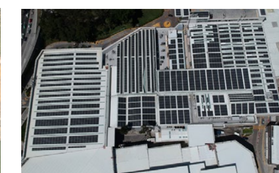
Supermärkte & Einkaufszentren