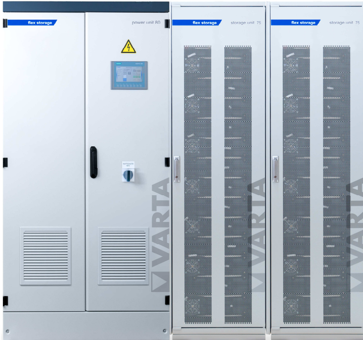
Abbildung 1: E 80/150 – beispielhafte Darstellung (Abbildung ähnlich)