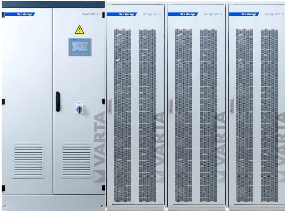
Abbildung 1: E 80/225 – beispielhafte Darstellung (Abbildung ähnlich)